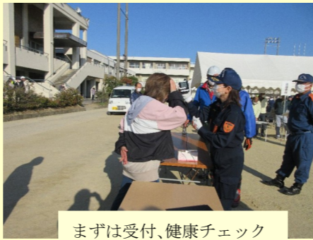
まずは受付、健康チェック