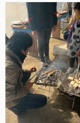
出来ました、うまそう！