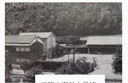
当時の東谷小学校