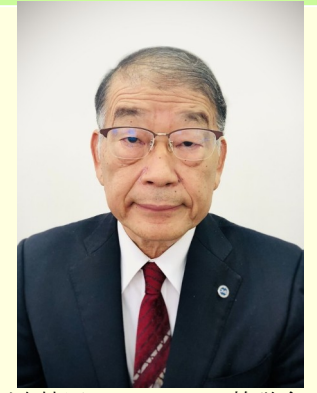
NPO法人川東校区コミュニティ協議会

最後に、皆様方にとって今年が輝かしい年となりますよう、心からお祈り申し上げます。